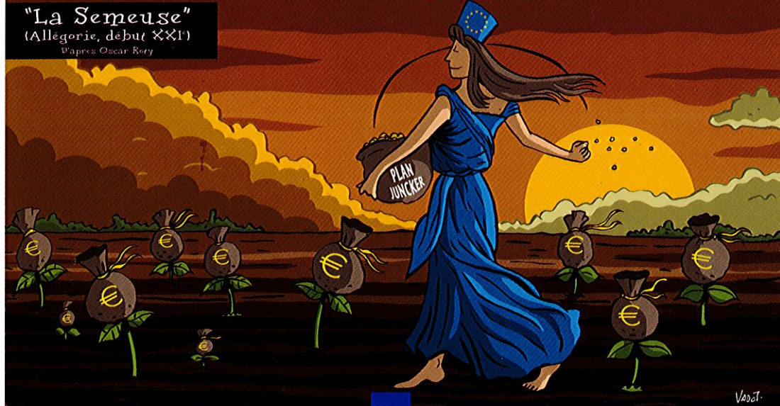
"La Semeuse" (Allegorie, début XXI) D'après Oscar Rey