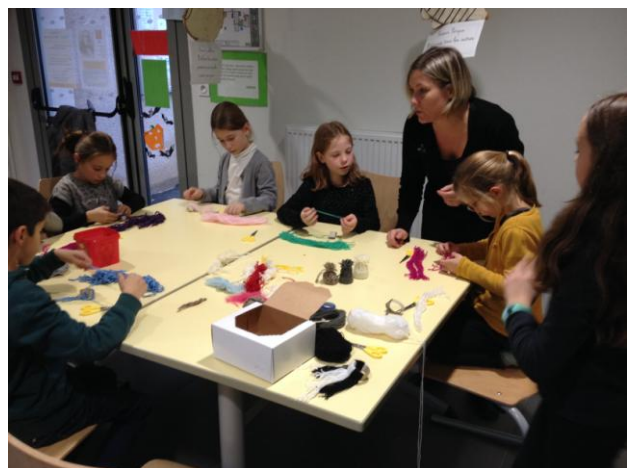
Activités de Noël