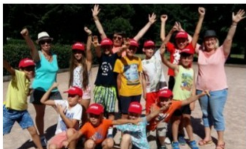
Temps d'activités péri-scolaires

(*) – Les championnats ont eu lieu le dimanche 21 mai de 9h à 23h : 234 joueurs sur nos aires de jeux .