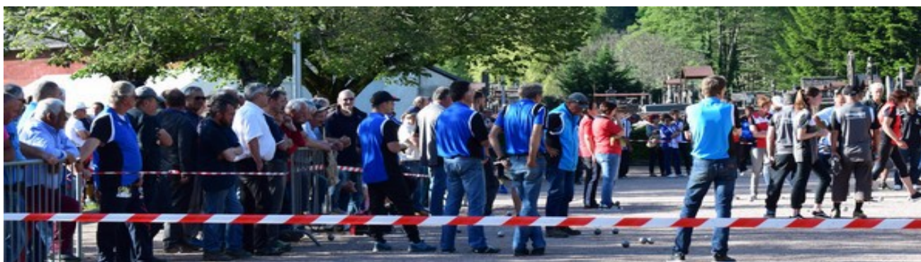
Joueurs et spectateurs lors des finales des championnats

(*) – Les championnats ont eu lieu le dimanche 21 mai de 9h à 23h : 234 joueurs sur nos aires de jeux .