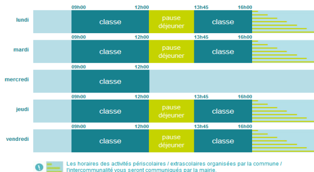
Horaires de l'année scolaire 2017 - 2018 École maternelle publique Etienne Labrunie - Vic-sur-Cère (15800)